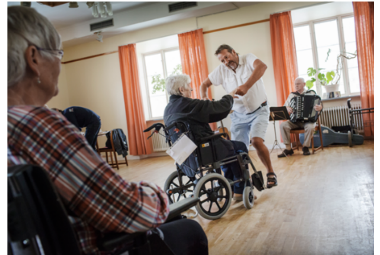
Rullstolsdans på Korsbygården i Lärbro

De regionala kulturinstitutionerna har handlingsplaner för fysisk tillgänglighet och arbetar kontinuerligt med att förbättra tillgängligheten för att bidra till att de nationella målen för funktionshinderspolitiken uppnås 9 .