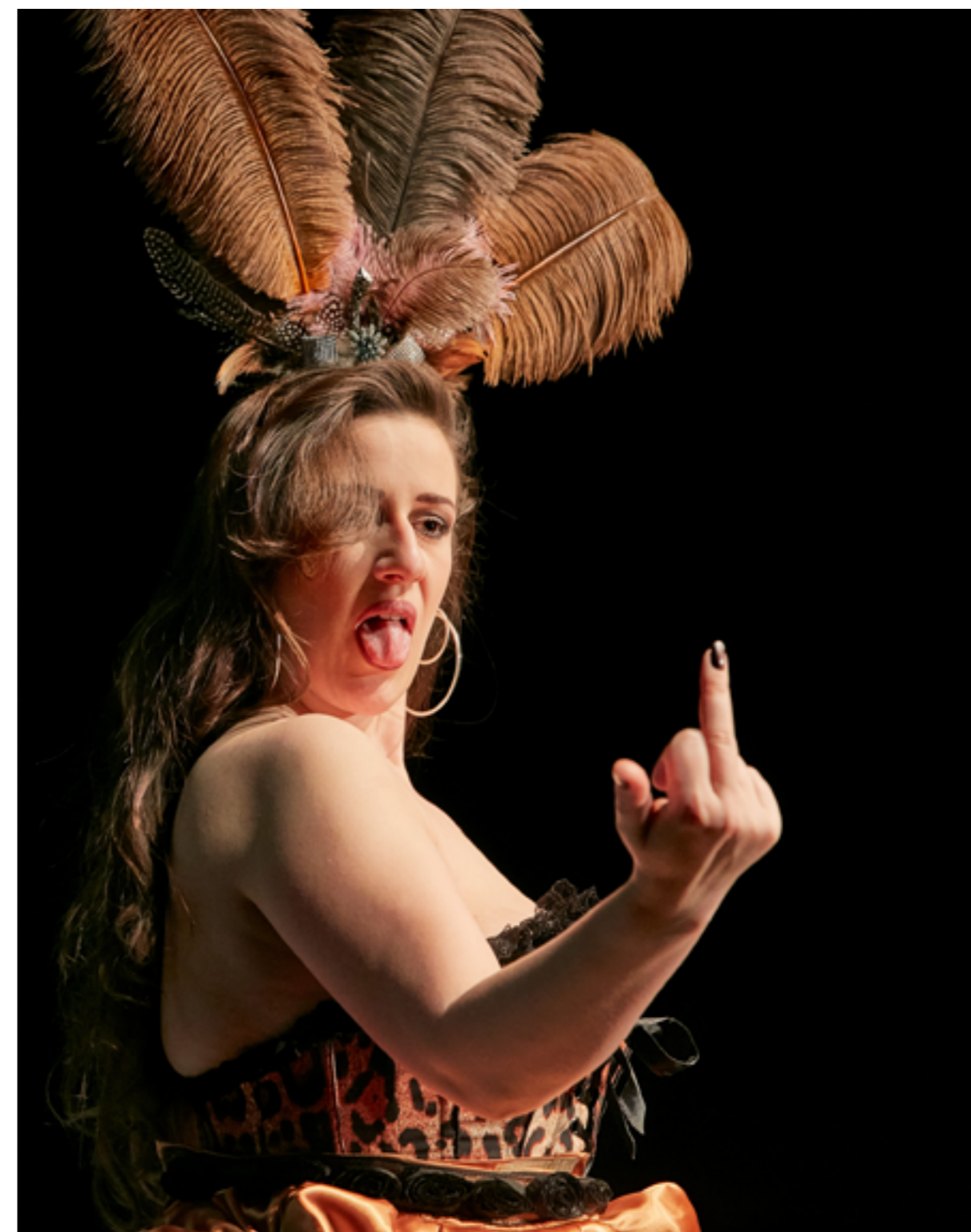
En provokativ scen ur teatergruppen Unga Romas ”Att bossa en bitch” som är Shakespeares ”Så tuktas en argbigga” överförd till dagens samhälle. Bitchen vill inte bli bossad, och bilden kan här få stå för jämställdhet och ”metoo”, men också för vikten av armlängds avstånd till den konstnärliga friheten och som en förbannelse från kulturlivet som drabbats så väldigt hårt av coronapandemin. (foto: Roland Hejdström).