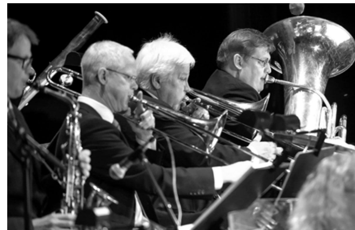
En sektion ur Gotlandsmusikens orkester

När mötesplatser och estetiska/konstnärliga utbildningar finns stimuleras samverkan och förutsättningarna för att individer och organisationer mer aktivt ska kunna arbeta med att internationalisera sina verksamheter.