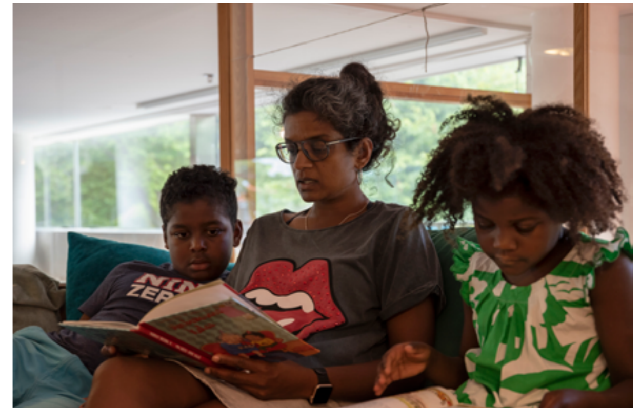
Högläsning på Almedalsbiblioteket en varm sommardag i augusti 2020.

i infrastrukturen för demokrati och social hållbarhet. Biblioteken har en unik närhet till invånarna i deras lokalsamhällen och bidrar till människors lärande, personliga utveckling och delaktighet i samhället. Verksamheten tar sin utgångspunkt i UNESCO:s folkbiblioteksmanifest samt FN:s förklaring om de mänskliga rättigheterna och regleras av bibliotekslagen. Enligt lagen ska biblioteken verka för det demokratiska samhällets utveckling genom att bidra till kunskapsförmedling och fri åsiktsbildning, främja litteraturens ställning och intresset för bildning, upplysning, utbildning, forskning och kulturell verksamhet i övrigt 26 .