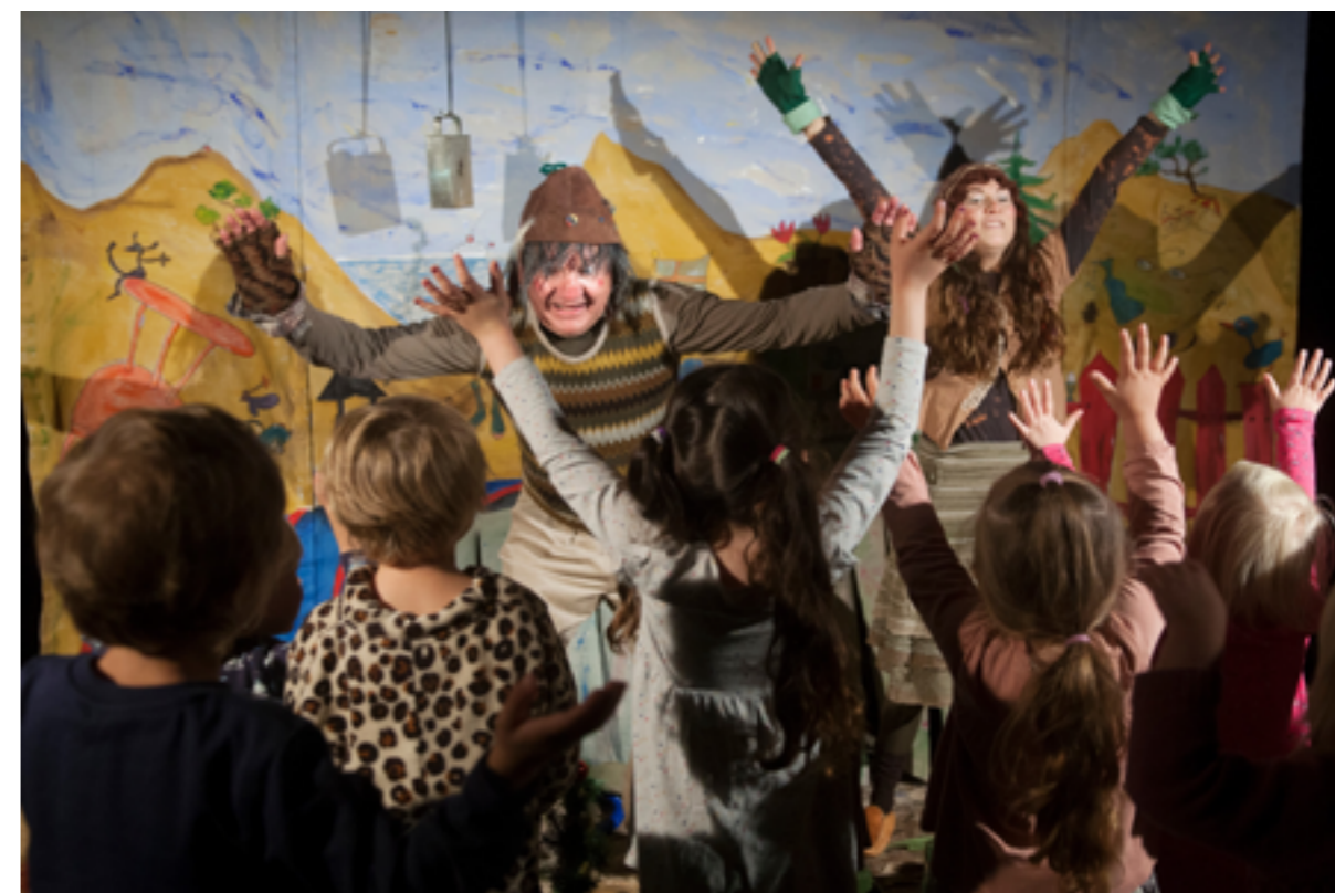
Länsteatern gör varje år turnéer över hela ön. Här är det barnföreställningen "Skrotnissar" som gavs i 104 (!) föreställningar under vintern 2019/20 på teatern, på förskolor och på varuhuset Coop i Visby.

dans, teater, musik, konst och andra kulturyttringar. Samverkan mellan kulturinstitutioner, skolor, bibliotek, ungdomsgårdar och studieförbund kan utvecklas genom samverkansgrupper, återkommande gemensamma arrangemang och mål. Detta kan i längden skapa mer verksamhet både för kulturaktörer och för målgruppen. En synergieffekt av detta blir att mängden av framtidens kulturbärare fylls på, både i form av utövare och av konsumenter.