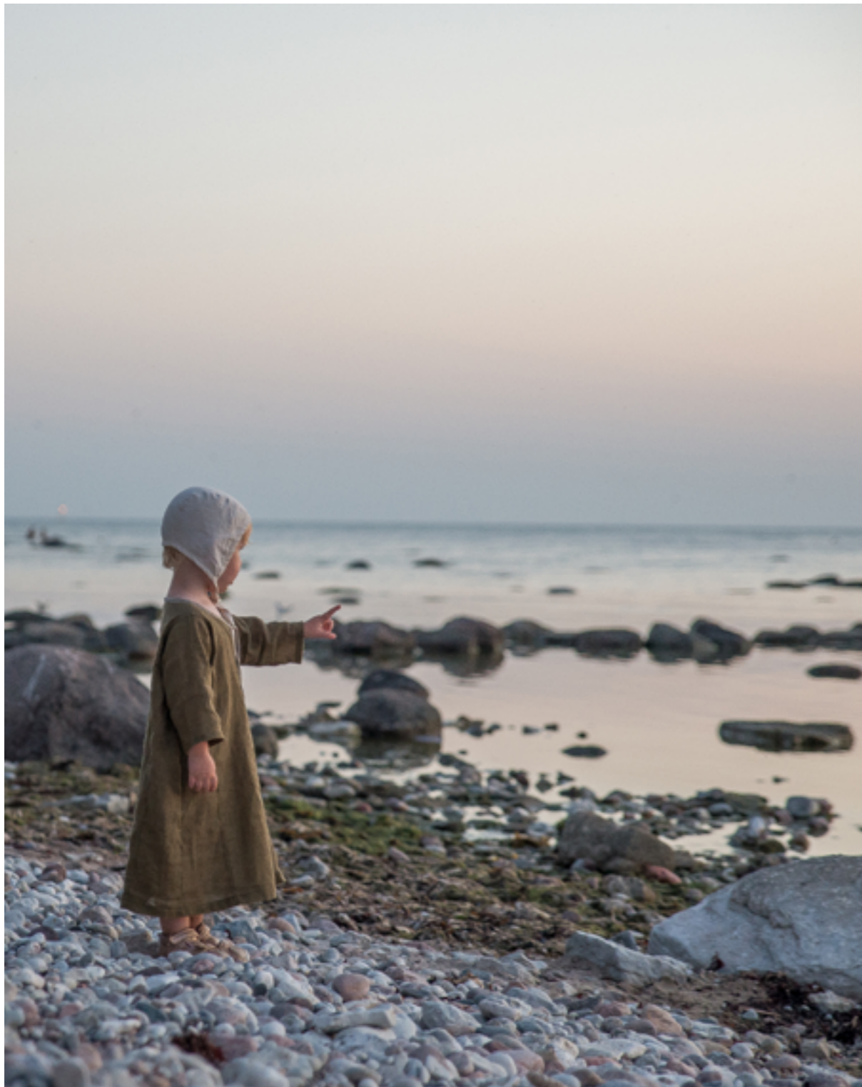
En av de yngre deltagarna vid Medeltidsveckan, Gotlands största arrangemang med 40.000 besökare varje år i vecka 32.