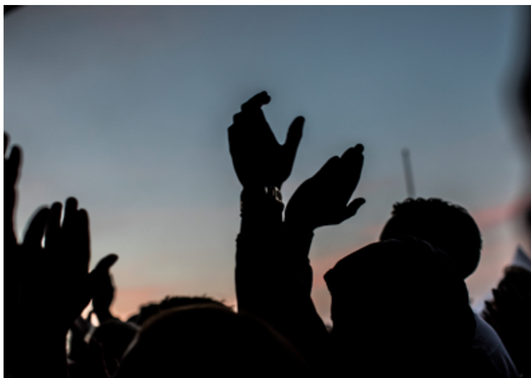
Applåder och tack.

Vi tackar våra gotländska fotografer för bra bilder som beskriver det vi på alla andra sidor försöker säga i ord. Och avslutningsvis tackar vi Gutamålsgillet för ”sammenfattningen”.