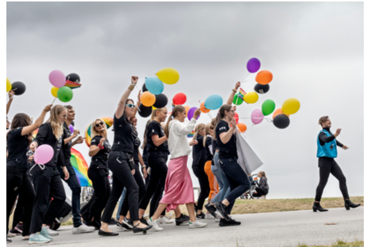
Prideparad i Visby i samband med Almedalsveckan 2019, med Region Gotland som medarrangör.

Här är våra bibliotek och våra studieförbund viktiga aktörer genom att tillhandahålla en fri och kostnadsfri mötesplats respektive genom sitt folkbildningsarbete och de sociala möten som sker i studiecirkeln. Gotland har också visat sig ha stora kvaliteter och öppna hjärtan i mottagandet av flyktingar från andra kulturer. Våra konstnärsresidens och deras många gästande internationella konstnärer tillför också kunskap och breddar både utblick och insikt.