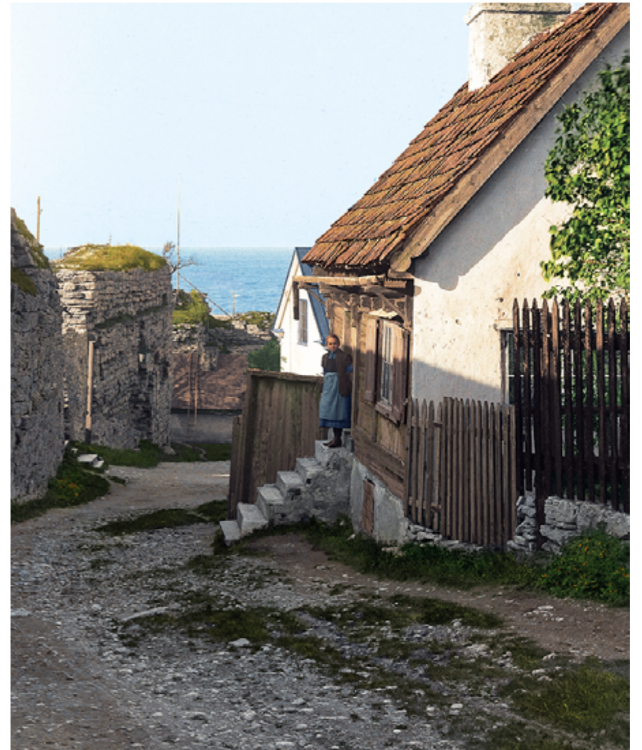
Arkivcentrum förfogar över ett rikt material av fotografier. Här ett foto från Södra Slottsgränd i Visby taget 1895. Här har man levandegjort en svunnen stadsmiljö genom kolorering av ett svart-vitt originalfotografi som tillför en ny dimension av förståelsen av kulturarvet. (foto N. J. A. Lagergren 1895, kolorering J Backman-Jääskeläinen 2020. Något beskuren.)

fritt tillgängliga på nätet. Arkiven har en omfattande publik verksamhet, bland annat en programverksamhet med föredrag, kurser och visningar riktade mot olika målgrupper. Båda arkivinstitutionerna har ett väletablerat samarbete med andra kulturinstitutioner, med föreningsliv samt med utbildningsväsendet och är en viktig resurs för bildning och i det livslånga lärandet. Genom Arkivcentrum finns goda förutsättningar för att på nära håll ta del av och arbeta med källmaterial.