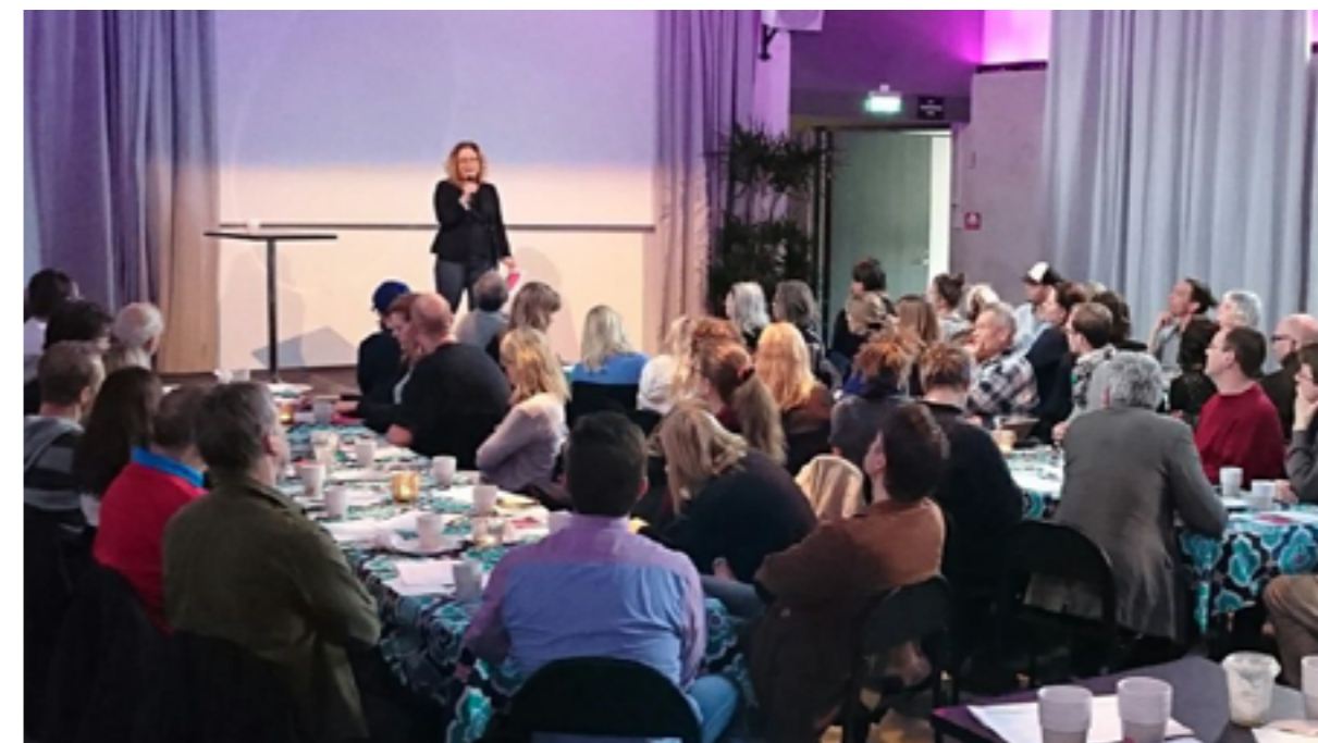
Motsatt sida: En väsentlig del i utarbetandet av kulturplanen har varit de dryga trettioåttio välbesökta dialogmöten som genomförts.

Kulturplanens texter utarbetades under vintern, i nära samråd med områdesansvariga konsulenter och institutionschefer och internt och tvärsektorielt inom Region Gotland. Ett remissförfarande genomfördes under maj-juni 2020 och remissvar och -synpunkter arbetades in i planen under sommaren. Avstämningar med referens- och styrgrupp har skett fortlöpande innan kulturplanen slutligen fastställdes av regionfullmäktige den 16 november.