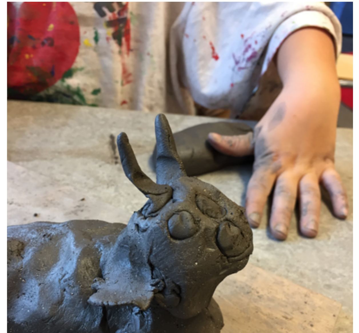
En keramiker i vardande... Bild från verksamhet inom Skapande skola.

Områdena slöjd, form och design behöver mötas för att komma till sin rätt och utvecklas. Det gör området komplext men också fullt av möjligheter. På så sätt blir slöjd ett kunskapsämne/område som också angår konsthantverket och produktion inom småskalig design.